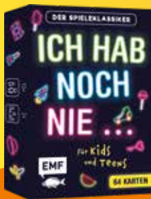
Ich hab noch nie ... – für Kids und Teens GTIN 4260478342101